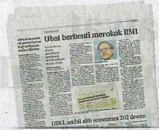
Keratan akhbar BH 18 Ogos 2019.

"Kalau hendak berhenti merokok, boleh pergi ke klinik kesihatan. Kalau tidak boleh dan susah untuk berhenti merokok, jangan merokok di restoran dan di hadapan orang lain," katanya.